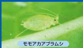
モモアカアブラムシ