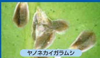
ヤノネカイガラムシ