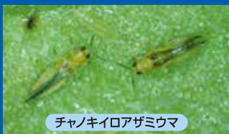
チャノキイロアザミウマ